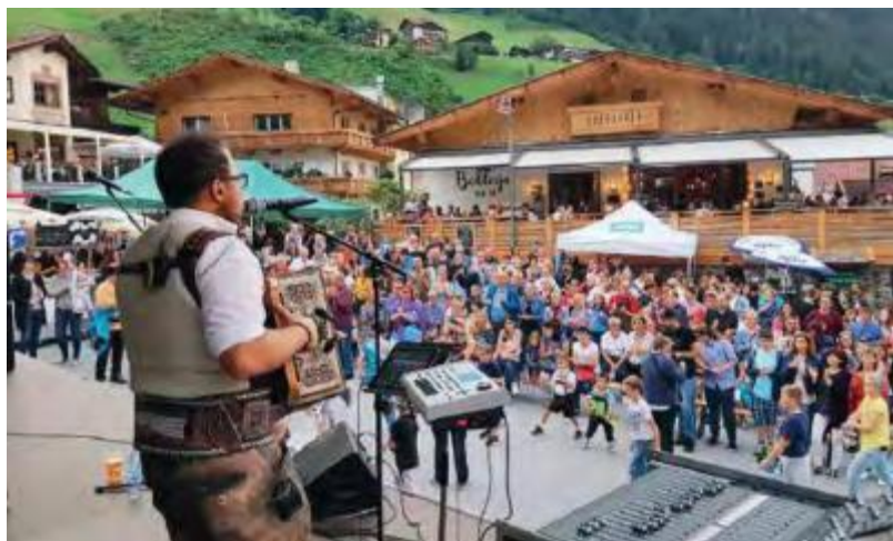
In der Zeit von 01. Juni bis zum 30. September 2026 verwandelt sich das Dorfzentrum Neustift jeden Abend in eine belebte Fußgängerzone.

G erade in den Abendstunden entfaltet das Dorfzentrum in Neustift seinen besonderen Reiz und mit der täglichen Fußgängerzone zwischen Dorfplatz, Franz-Senn-Platz und der Bachertalbrücke entsteht ein Ort, der Tradition und urbanes Leben auf charmante Weise verbindet. Großzügige Flächen und liebevoll gesetzte Details wie den neuen Sitzgelegenheiten am Franz-Senn-Platz und im Widumgarten laden zum Verweilen ein. Kinder spielen unbeschwert, Jugendliche genießen die lockere Atmosphäre und Erwachsene lassen den Tag entspannt ausklingen.