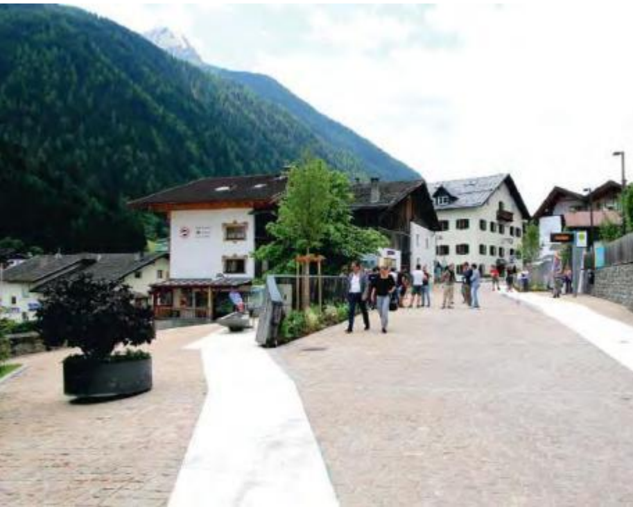
From 01 June to 30 September 2026, Neustift village centre transforms into a relaxing pedestrian area every evening.

In summer, when the evening sun slowly sinks behind the peaks, the Neustift village centre transforms into a lively pedestrian zone full of enjoyment, encounters and cultural highlights – daily from 1 June to 30 September 2026 from 4pm until midnight.