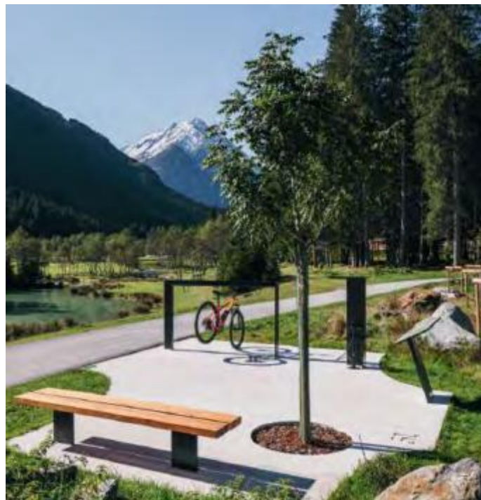
If you want to discover the Stubai Valley on two wheels, the Stubai cycle route is the perfect choice. The approximately 40-kilometre-long path from Falbeson to Kirchbrücke Bridge is a real highlight for all those who want to combine nature, exercise and enjoyment.

the air feels fresher, the light clearer and the glacier towers above everything. Despite the still moderate slope, you can feel that you are moving in alpine terrain. Just before the end of the route in Falbeson, the Klaus Äuele Kids' Park awaits. Here the bike tour is rounded off in adventure style. Climbing walls, flying fox, low ropes course and even a raft mean that children will be happy to get out of the saddle. But if they're not done with the cycling just yet, they can still do a few laps in the new Kids Bike Park Klaus Äuele. Parents should be prepared for the fact that a schedule doesn't count for much on the Stubai cycle route – the possibilities are too tempting.