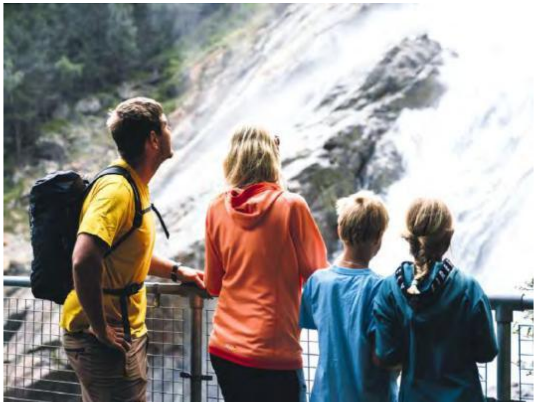
With twelve selected natural sites, nine impressive mountain lakes and the unique WildeWasserWeg, the Stubai Valley offers an impressive variety of places of power and retreat.